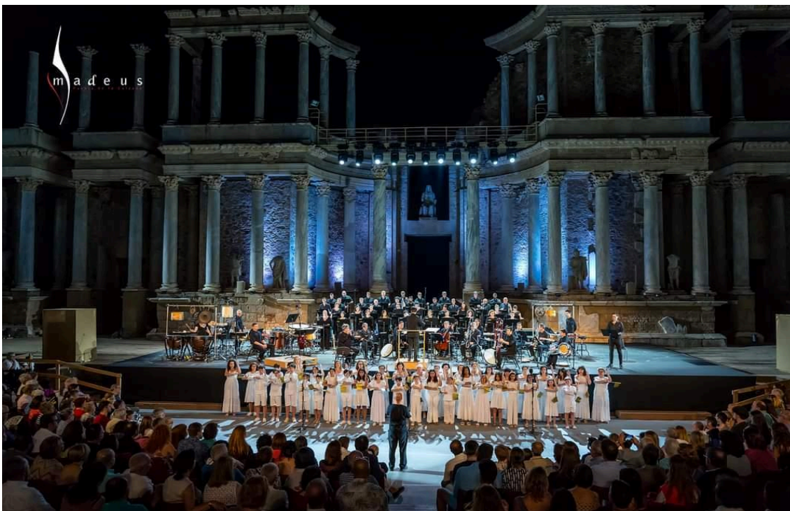
Coro Amadeus-IN, OCAZENigma, Teselas Ensemble Vocal.