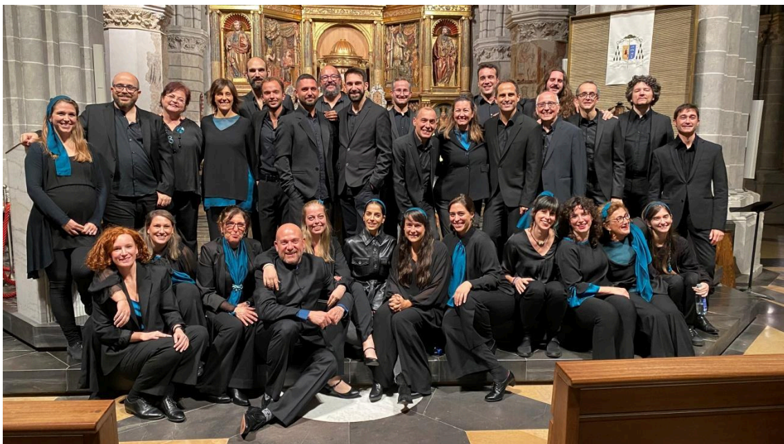
Mayor de Caspe.

configurado a través de las piezas ya transcritas en los Cuadernos de Polifonía Aragonesa que la propia Institución lleva publicando desde hace 30 años. Se realizaron dos conciertos: el primero de ellos fue en la Catedral de Tarazona y el segundo, en la Colegiata Santa María la